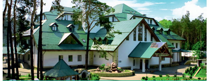
Екологічна сертифікація послуг

Здійснюється на основі 20 упродовжених стандартів для основних категорій харчової продукції, що встановлюють критерії визначення їх екологічних переваг. Екологічно сертифіковані продукти зазвичай мають найменші показники енергоємності та екологічних впливів на усіх етапах життєвого циклу, не містять ГМО та харчові домішки не натурального походження; відповідають вищим стандартам якості та вимогам до пакувальних матеріалів.