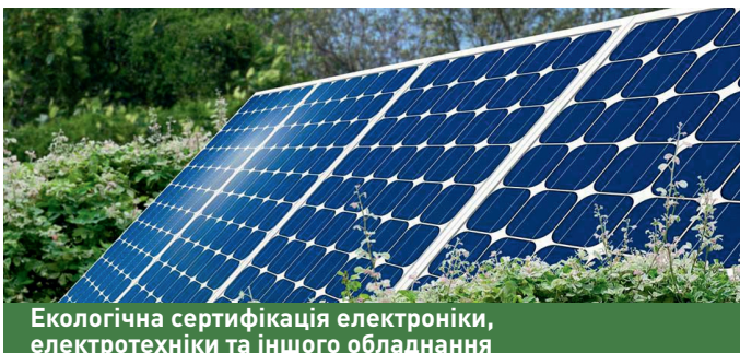
Екологічна сертифікація електроніки, електротехніки та іншого обладнання

Здійснюється на основі стандарту для будівель та споруд COY OEM. 08.002.36.074., який може розглядатися як еквівалент стандартам сертифікаційних систем LEED, BREEAM. Цей стандарт охоплює такі аспекти як якість підготовки та управління проектом; комфорт і якість зовнішнього середовища; якість архітектури та планування об'єкта; екологічні впливи в процесі будівництва; комфорт та безпека внутрішнього середовища; експлуатаційні характеристики, у т.ч. енергоефективність.