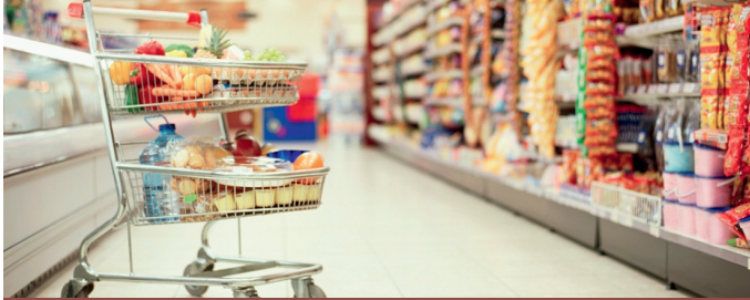
Екологічна сертифікація харчових продуктів

Орган сертифікації був створений у 2003 році в рамках проекту «Розвиток сталого споживання та виробництва в Україні», як компонент програми екологічного маркування I типу згідно ДСТУ ISO 14024:2002. З 2004 року він представляє Україну в міжнародній мережі – Global Ecolabelling Network (GEN), а знак маркування «Зелений журавлик» включено до міжнародного реєстру. На даний час в Україні орган сертифікації «Жива планета» є єдиним акредитованим органом з екологічного маркування, результати оцінки відповідності якого визнаються у 60 країнах світу.