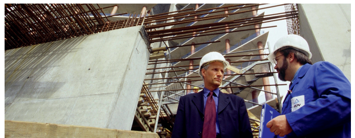
Екологічна сертифікація будівель та споруд

Здійснюється на основі 7 упродовжених стандартів для основних категорій будівельних матеріалів та стандарту на лакофарбові матеріали, що встановлюють критерії визначення їх екологічних переваг. Екологічно сертифіковані будівельні та лакофарбові матеріали зазвичай мають найменші показники енергоємності та екологічних впливів на усіх етапах життєвого циклу, не містять високотоксичних речовин та інших речовин шкідливих для здоров'я людини; відповідають вищим стандартам якості та вимогам до пакувальних матеріалів.